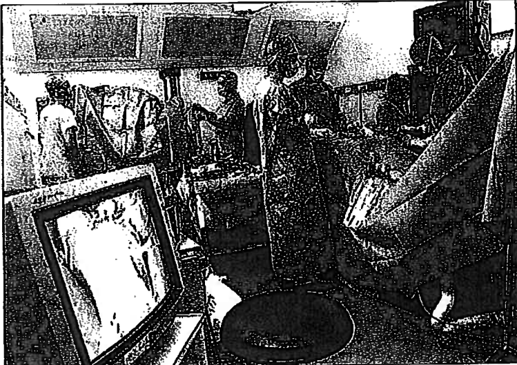
Dans le traitement des cancers, les techniques chirurgicales innovantes ne sont pas forcément mises en œuvre dans tous les établissements. (D'APRÈS DR COSNARD)